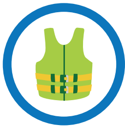
シュノーケリング中は、ライフジャケットを着用する。