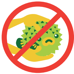
生きている、死んでいるに関わらず、海中生物を収集しない