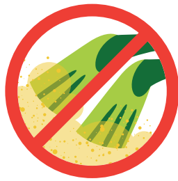
海底の砂をかき回さない