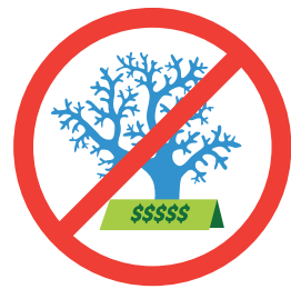
珊瑚や海中生物のおみやげを買わない