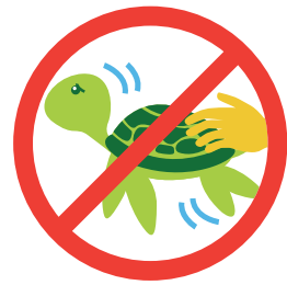
海中生物を追いかけたり、触ったりしない