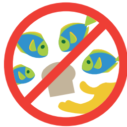
魚に餌をやらない