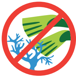
珊瑚の上に立たない