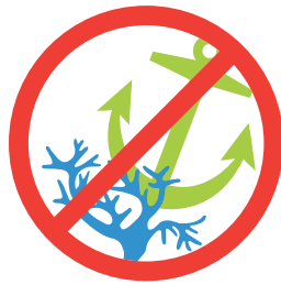
珊瑚礁にアンカーを下ろさない