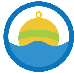
係留ブイを使用する