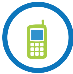
環境法違反を報告する