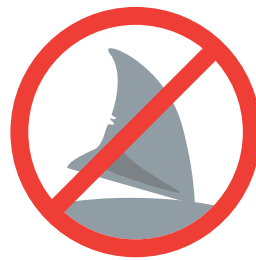
ヒレ目当てのサメ漁をサポートしない。